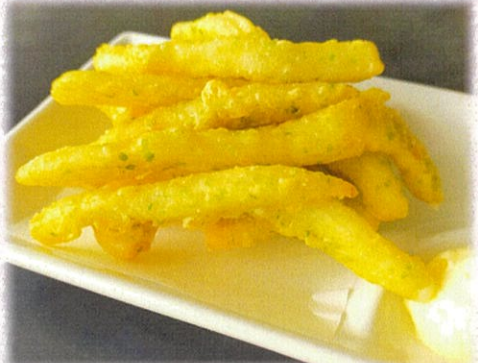
【イカの磯辺揚げ】 605円(税込)