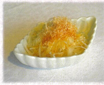
【オニオンライス】 484円(税込)