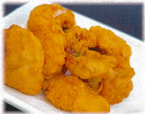
【タコの唐揚げ】 770円(税込)