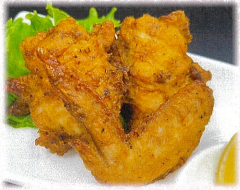
【手羽先・手羽元炙り焼き】 792円(税込)