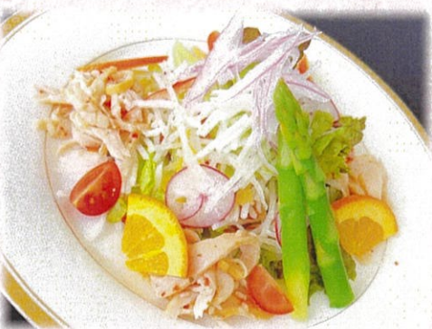
【彩り野菜サラダ】 660円(税込)