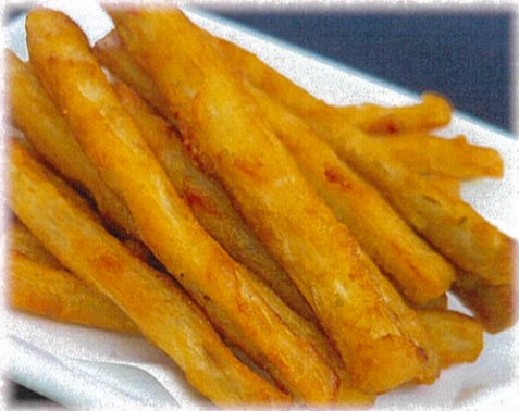
【ゴボウの唐揚げ】 792円(税込)